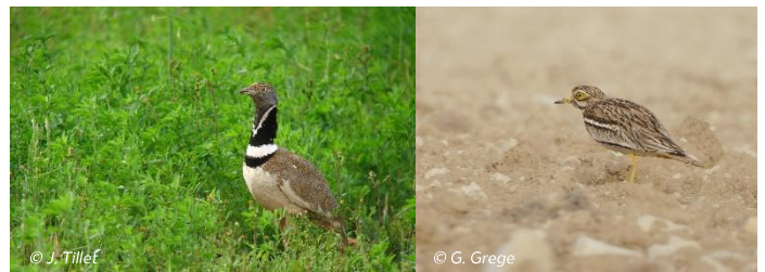
Outarde canepetière mâle

Ce vaste site couvre un territoire de 375 km 2 , près de trente communes, de Neuville-de-Poitou à Moncontour. À l'Ouest, le site Natura 2000 de la Plaine d'Oiron-Thénezy est désigné pour les mêmes espèces est animé par le Groupe Ornithologique des Deux-Sèvres.