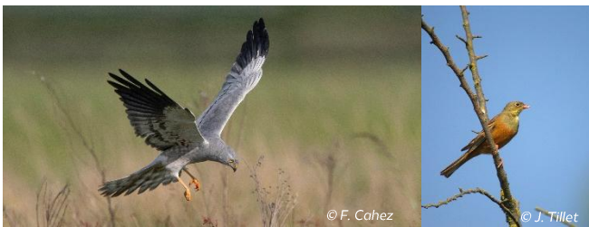
Busard cendré mâle

Les plaines du Mirebalais et du Neuvilleois appartiennent à un ensemble de sites terrestres et marins européens, le réseau Natura 2000, choisis pour préserver les milieux naturels, la faune et flore exceptionnelles qu'ils abritent.