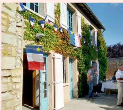
↳ Réhabilitation de La Maison de l'Acadie