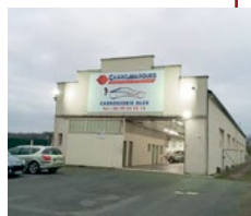
f carrosserie Alex

Tél. 05 49 22 43 10 / alex.carrosserie86200@gmail.com