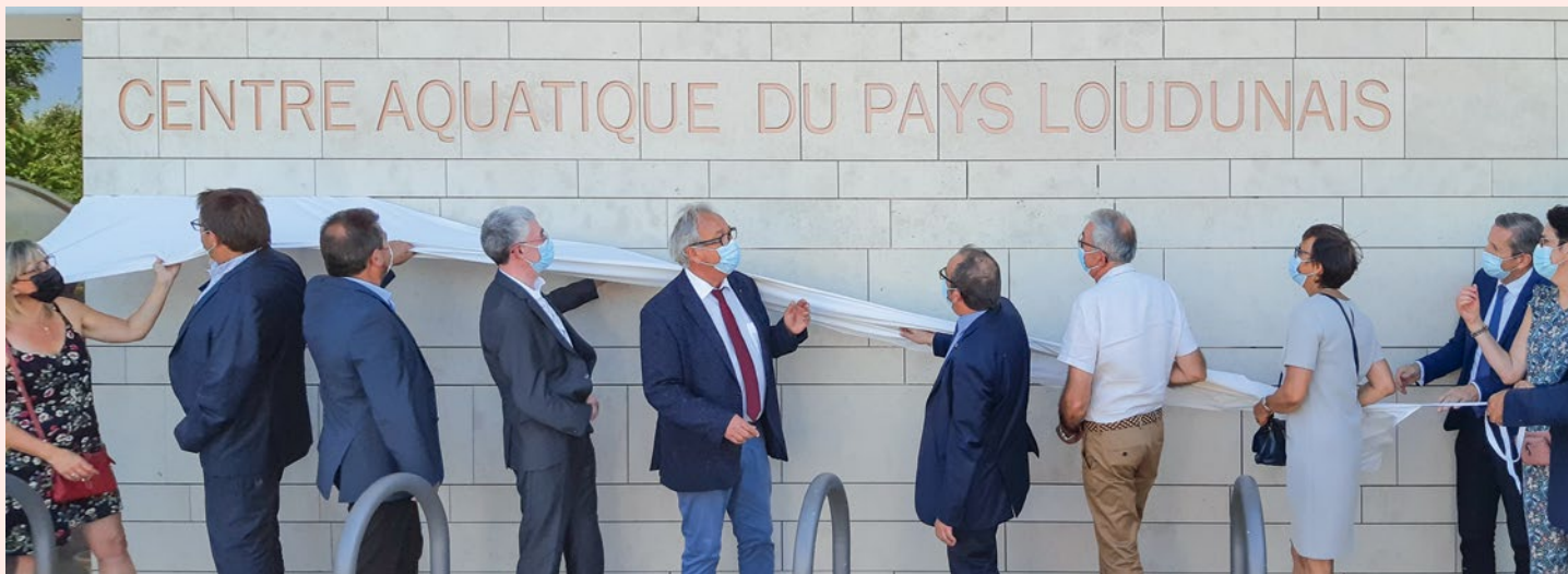
↳ Inauguration du centre aquatique intercommunal