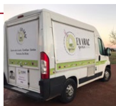
f En Vrac Épicerie

Tél. 06 63 75 77 65 / adelaid@envrac-epicerie.fr