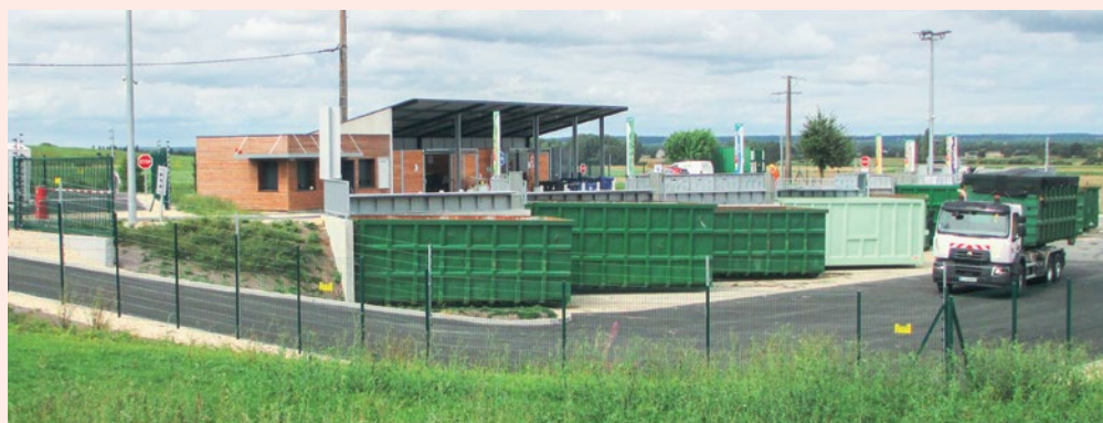
↳ Réhabilitation et extension des déchèteries de Loudun-Messemé et Les Trois-Moutiers